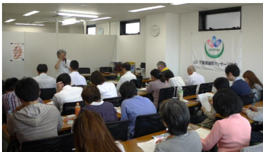
6/5の知久先生の講座も大盛況でした！

また、研修部では今後取り上げてほしいテーマ、講師を募集しております。研修に関するご意見とともに気軽にお寄せ下さい。