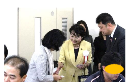
一人ひとりにご挨拶をしていただきました

協同組合は、理事、事務局一体となって、組合員の皆様の支えとなれるよう活動しております。 お仕事をするうえで疑問やお悩みがございましたら、是非、事務局までご連絡、ご相談ください。今後とも、よろしく願いいたします。